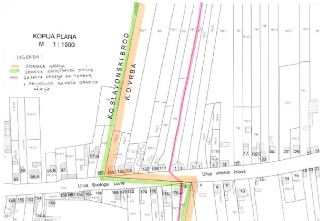
Slika 2 (Prijedlog imenovanja Ulice Svetog Lovre u naselju Gornja Vrba. Imenovana Ulica Svetog Lovre dio je k.č. 1339 k.o. Vrba od zapadne granice k.o. Vrba do kuće na k.č. 795/1 u k.o. Vrba s kućnim brojem 1 u Ul. vrbskih žrtava u naselju Gornja Vrba)