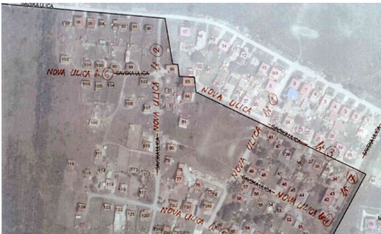
Slika 2. Primjer grafičkog priloga

Da bi svi zahtjevi bili ispunjeni i Registar birača imao točne i pouzdane podatke potrebna je suradnja svih Institucija koje su uključene u ovaj proces: od tijela koja odlučuju o imenovanju ulica, do tijela koja planiraju uređenje prostora, područnih ureda za katastar koja provode donijete odluke i akte, do resornog Ministarstva unutarnjih poslova koji izdaju dokumente na temelju javne isprave. Sve je veća nužnost i potreba praćenja promjena u prostoru kao i dostavljanja točnih i pouzdanih prostornih podataka radi što bržeg i efikasnijeg reagiranja na postavljenje zahtjeve. Ovog puta zahtjev je bio za točnim, ažurnim i dostupnim adresnim podatkom koji predstavlja jedinstven identifikator građevine u prostoru koja za sobom povlači i identifikaciju osoba preko prijavljene adrese. Osnivanjem Registra birača još se jednom, nakon opsežnog popisa stanovništva, pokazalo koliko su važni prostorni podaci, u ovom slučaju Registar prostornih jedinica, kojima raspolaže Državna geodetska uprava. DGU